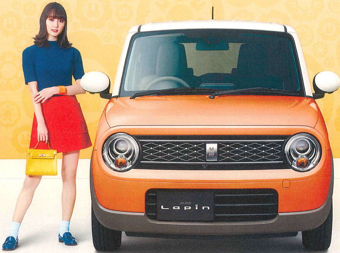
Photo:ラパン Sセレクション 全方位モニター用カメラバックミラー装着車 ボディーカラーはリフレクティブオレンジメタリック ホワイト21-ルーフ