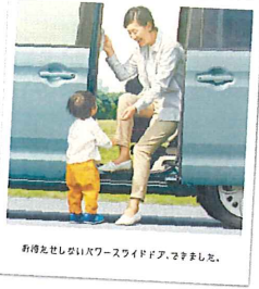
お得な新しいパワー・スライドドア。さきまして。