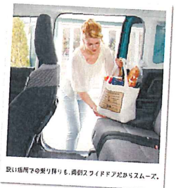
取っ手の乗り降りも、両側スライドドアだからスムーズ。