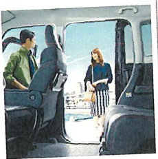
速く広いパワー・スライドドア。乗り降りでもっとスマートに。